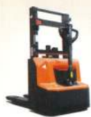
980kg 電動スタッカー nanostacker