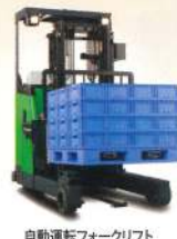
自動運転フォークリフト Rinova AGF Advanced Robot Forklift