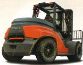
高性能電動フォークリフト(開発中)

お客様の軽労化ニーズに合わせて新発売した『980kg 電動スタッカー nanostacker』や安全運転を評価するサービス『運転動画 AI解析』、電動フォークリフト用スポットクーラー『TI-COOL』、後方作業者検知運転支援システム『SEnS+』など、安全・快適商品を実機展示いたします